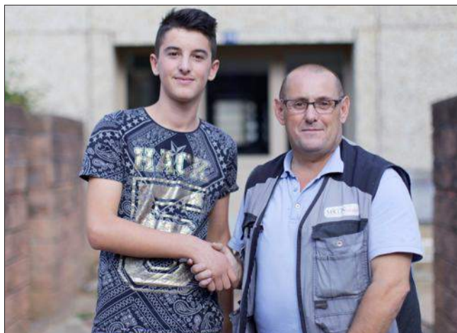
Un des quinze portraits réalisés par le photographe. Ici un jeune du Damie avec le gardien du logement.

« Je devais prendre en photo des jeunes pour