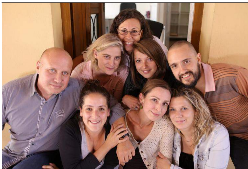
Joignable 7 jours sur 7, l'équipe du Dispositif d'accueil pour les mineurs isolés étrangers est composée de huit personnes dont un psychologue. Tous défendent les mêmes valeurs et font preuve de beaucoup de cœur et d'humanité avec les bénéficiaires.

Une des principales missions du Damie est l'accueil d'urgence. L'équipe répond aux besoins essentiels des