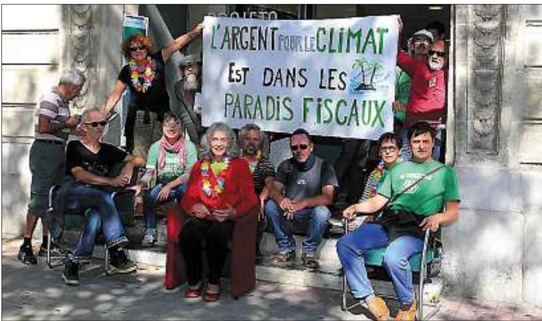
► Attac appelle également les citoyens à héberger chez eux les chaises réquisitionnées.

Opération commando d'Attac à Narbonne: les militants ont fauché des sièges à BNP Paribas.