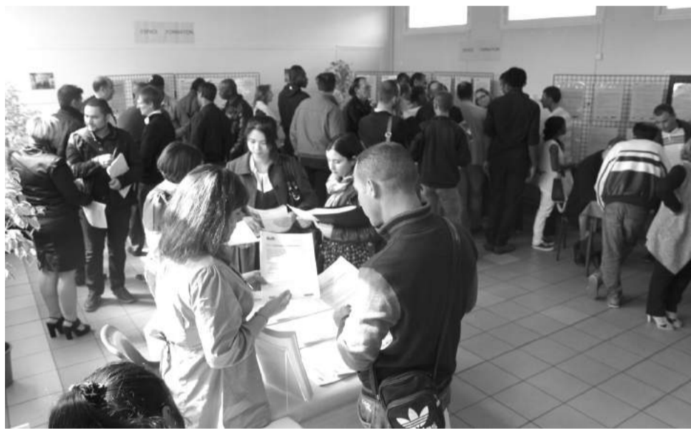
➤ Quatre Zoom métiers ont été organisés déjà. Le prochain, qui se tiendra le 15 octobre prochain, est consacré aux métiers de l'hôtellerie et de la restauration.

Depuis cinq ans, la Ville organise donc des « Zoom métiers » (dans le cadre de son accompagnement à l'insertion professionnelle), petits salons ponctuels faisant le point sur un thème précis selon l'actualité (les participants peuvent échanger avec des professionnels, se renseigner sur les métiers du secteur en question, découvrir les cursus de formation et écouter des témoignages de salariés). « Quand le nouveau centre commercial Aéroville a ouvert ses portes près de Roissy, nous avons porté le Zoom métiers sur la grande distribution spécialisée et la vente », précise-t-on au cabinet du maire. D'autres sessions ont été organisées sur les domaines du commerce et de la distribution, du service à la personne ou encore de la logistique. « Nous visons un secteur dont nous savons qu'il va embaucher