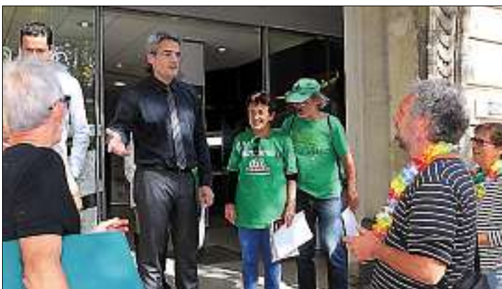
► Echanges sur le perron de la BNP Paribas...