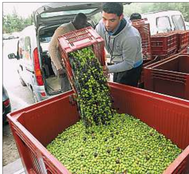
► L'olive vedette de l'Oulibo à Bize, devient une AOC.

L'Oulibo, capitale de la nouvelle AOC « Lucques du Languedoc ».