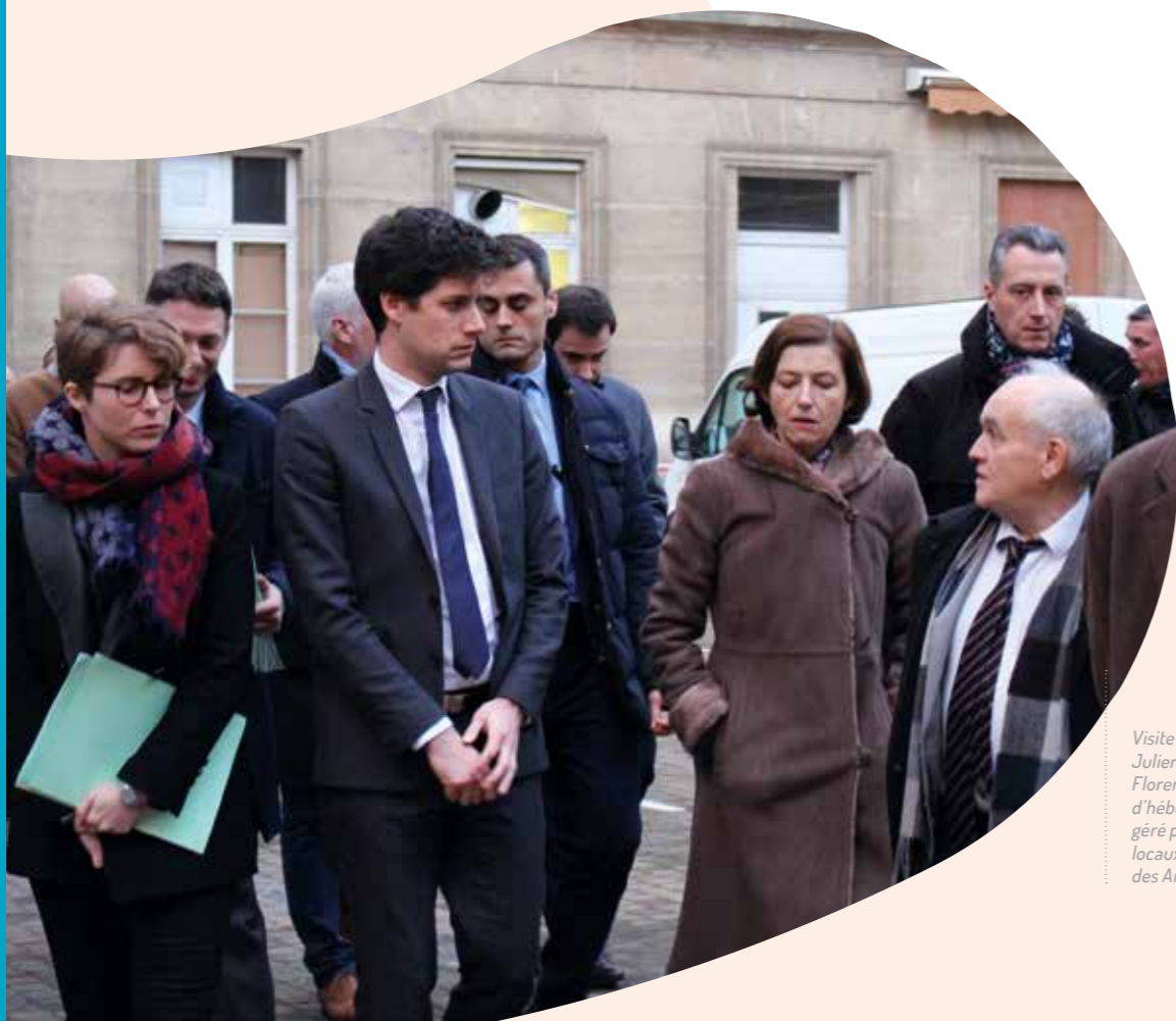
Visite des ministres Julien Denormandie et Florence Parly au sein d'un centre d'hébergement d'urgence hivernale géré par France Horizon dans des locaux mis à disposition du ministère des Armées - 12 décembre 2018