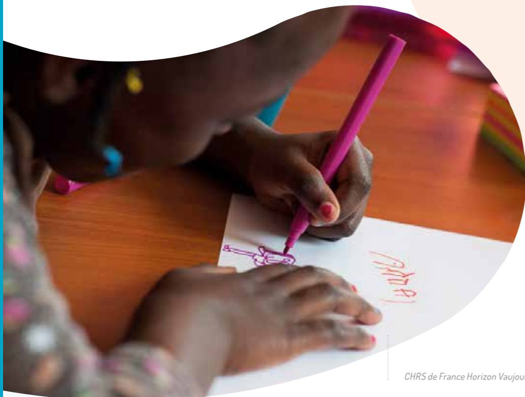
CHRS de France Horizon Vaujours