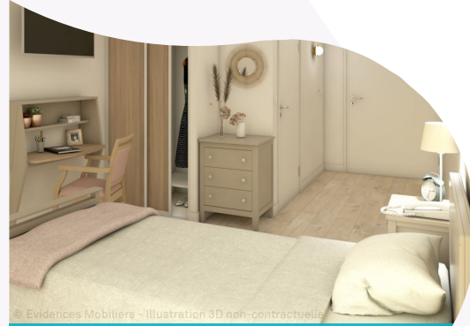
© Evidences Mobilière - Illustration 3D non contractuelle

L'équipe de la Résidence se mobilise au quotidien pour garantir à chacun, dans un cadre de vie agréable, sécurité, bien-être et convivialité.