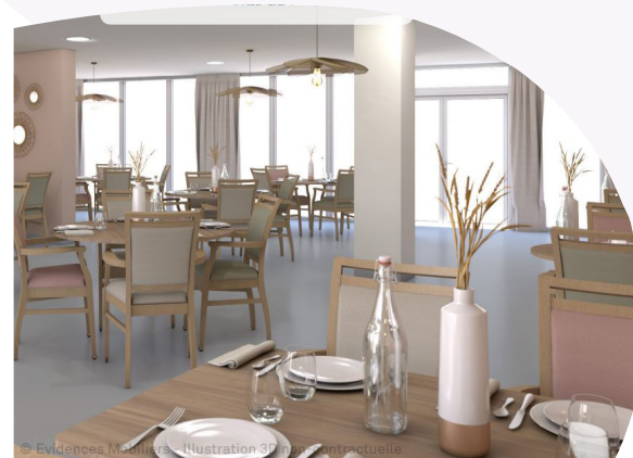
© Evidences Mobilière - Illustration 3D non contractuelle

Un programme d'ateliers individuels et collectifs organisé par notre animatrice rythmera votre quotidien.